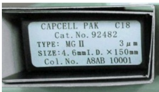
青色シール:MG/MG II 現行品