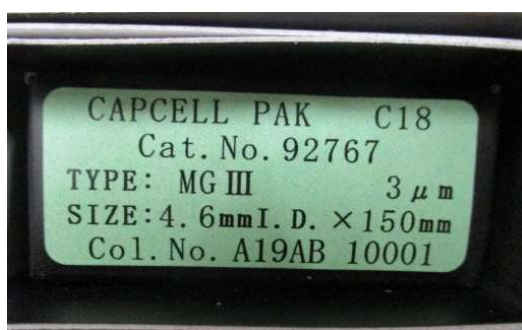
緑色シール:MG III / MG III-H 現行品